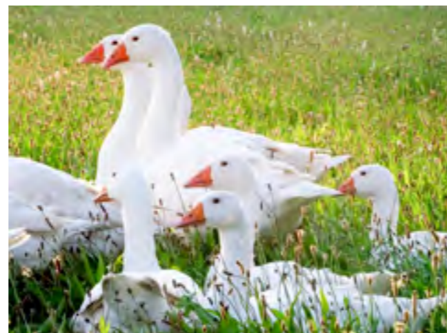
Die Weidegänse vom Hofgut Martinsberg verbringen den Sommer draußen, wo sie am liebsten Klee und Gras fressen.