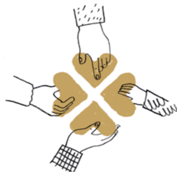
Die vier Blätter symbolisieren die vier beteiligten Interessengruppen. Nur zusammen ergeben sie die Genossenschaft.

Mehr Informationen zu den Personen, Organen und zur Funktionsweise der Genossenschaft finden Sie auf unserer Homepage unter xäls.de .